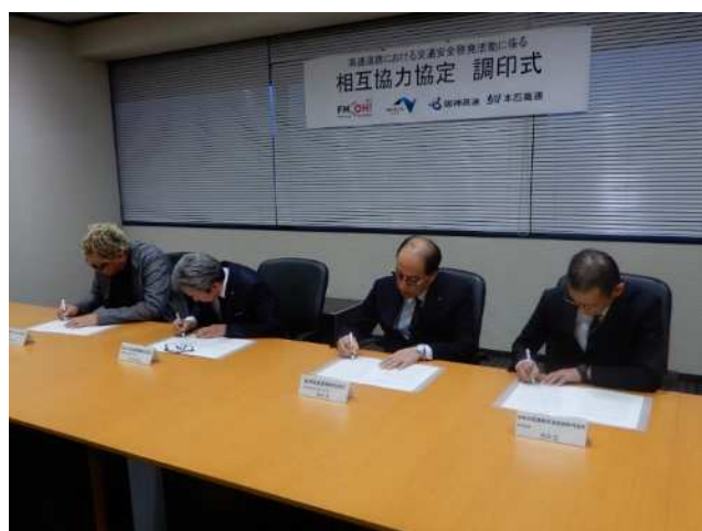
【2019年11月18日「高速道路における交通安全啓発活動に係る相互協力協定」調印式の様子】

○2020年4月から実施する「STOP! NAGARA DRIVING PROJECT」は、本協定に基づき実施するものとなります。