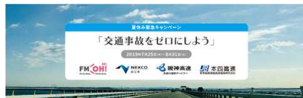
【夏休み緊急キャンペーン「交通事故をゼロにしよう」イメージ写真】