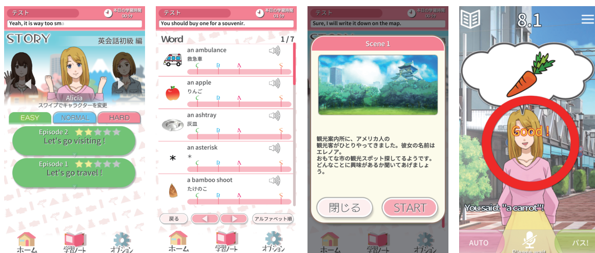
※画面は現在開発中のものとなります

英語力を伸ばすには学校に通って授業を受けるだけでなく、自身で学習をする時間の確保が必要です。つまり、自分で反復練習する時間や外国人との会話量を確保するために、学校の授業に加え「システムを使っていろいろなシチュエーションを体感し実際の会話をたくさん練習してもらいましょう」というのがアプリ制作の背景です。