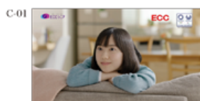
(声田さんオナナ) おばあちゃんが変わった。