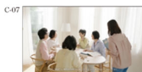
(別シニア) その秘密は、