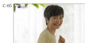
(メインシニア女性) なに？