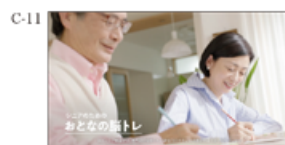
新コースがはじまりました。