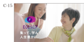
人生豊かに。 ECCシニア