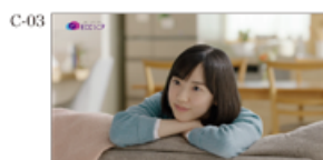
何だかいつも笑ってる。