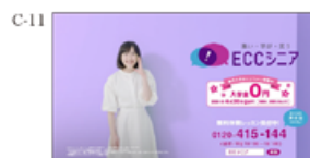
人生豊かに。 ECCシニア