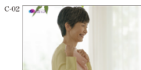
(声田さんオアNA) 最近のおばあちゃん