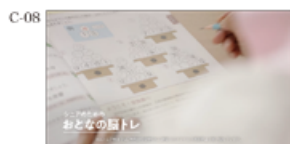
大人の脳トレコース!