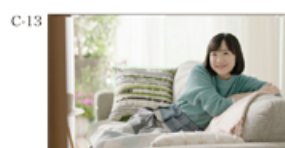
(声田さん) いってらっしゃーい！ (声田さんオナナ) なんか、輝いてる。