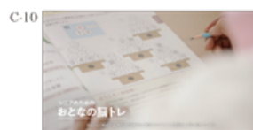
楽しみながら 脳を刺激する