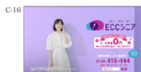
(声田さん) 無料体験レッスン受付中 大人の英会話も！