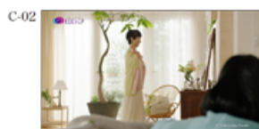
前よりオシャレになったし