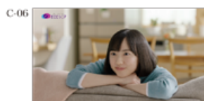
(声田さん) べつに。 (声田さんオナナ) 何があったんだろう？