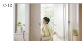
(メインシニア女性) いってきまーす！