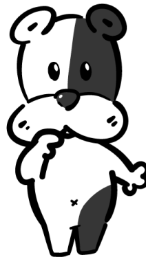
▲キャラクター ビジュアル