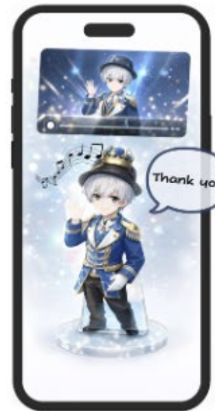
限定コンテンツを解除