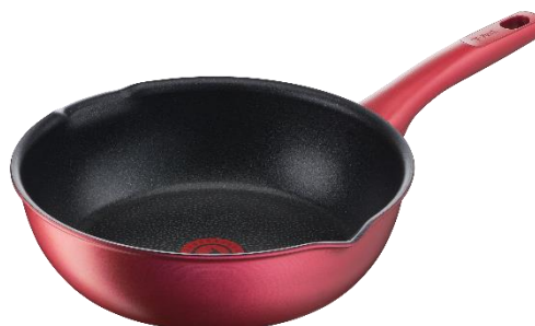
IH ルビー・エクセレンス マルチパン 26 cm