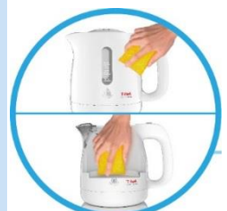
ウォッシュャブル 0.8L