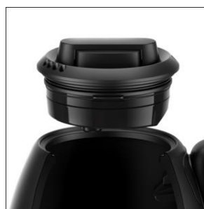
【倒れてもフタが外れにくい設計】