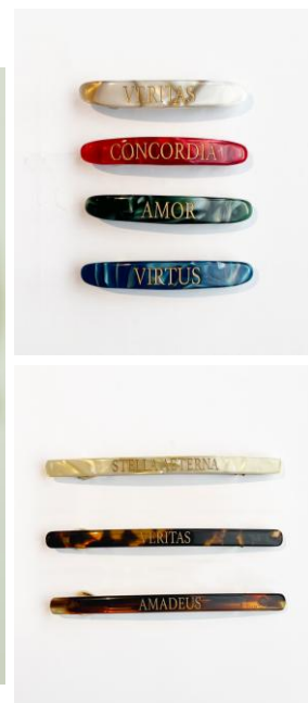
barrette (small) 2,640yen / barrette (large) 3,520yen