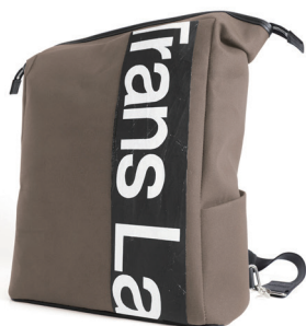
アーミーグリーン