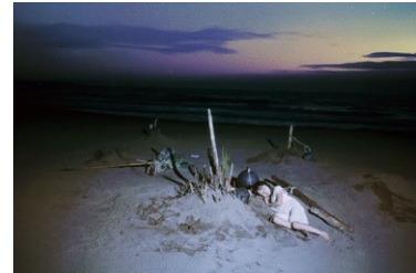
映画『コスモ・コルプス』(2025)