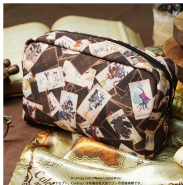
パブラシュカ王家 御用達ポーチ ¥4,180(税込)