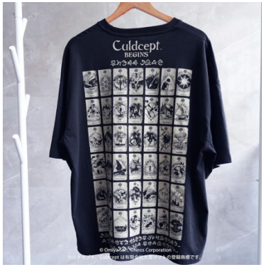
ビッグシルエットTシャツ クリーチャーカード ¥6,820(税込)