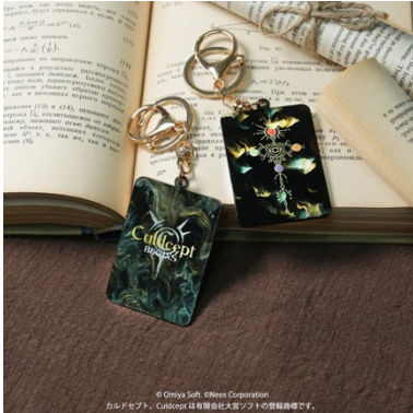
大理石風キーホルダー ¥1,650(税込)