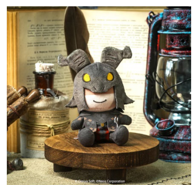
おすわりぬいぐるみ マスコット オリジン ¥3,850(税込)