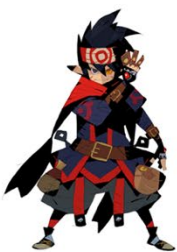
① 松浦聖氏描き起こし 「ゼネス」