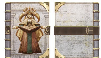
④ ブックカバー 「カルドラ(日本限定)」