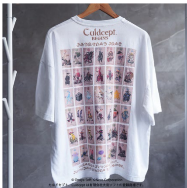
ビッグシルエット Tシャツ クリーチャーカード ¥6,820(税込)

メモ帳、クリアフォルダ、キーホルダー、キーケース、Tシャツ、オックスフォードシャツ、コースター、トートバッグ、グラス、ぬいぐるみ、ミニポーチ、小皿セットなど、全31種類を予定。【カルドセプト ビギンズ】の世界観やカードアートの魅力を日常でもお楽しみいただける、多彩なラインアップで展開いたします。