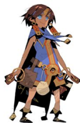
② 松浦聖氏描き起こし 「ナジャラン」