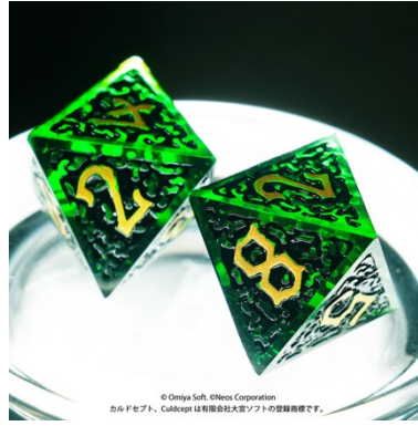
ダイス(2個入り) ¥3,520(税込)