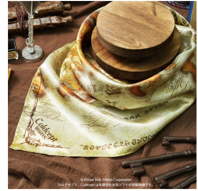
バンドナスカーフ パブラシュカ大陸図 ¥3,850(税込)