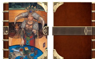
③ ブックカバー 「カルドラ(1st)」