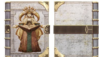
④ ブックカバー 「カルドラ(日本限定)」