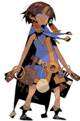
② 松浦聖氏描き起こし 「ナジャラン」