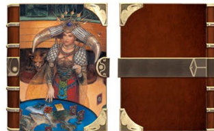
③ ブックカバー 「カルドラ(1st)」