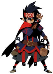
① 松浦聖氏描き起こし 「ゼネス」