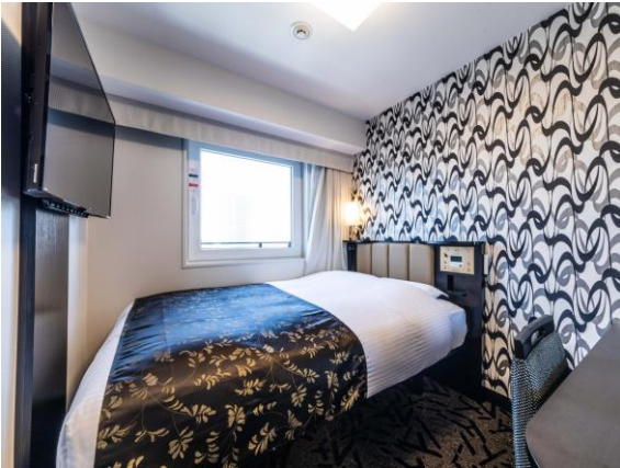
■スタンダードルーム