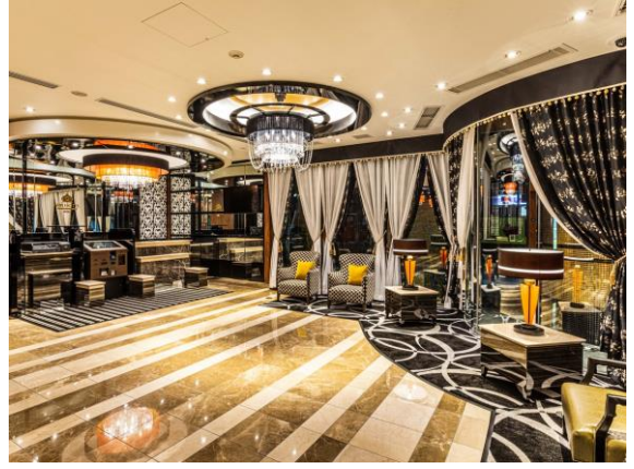
■エントランスロビー②