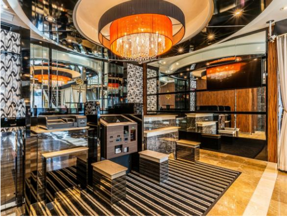
■エントランスロビー①