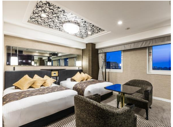
■デラックスツインルーム