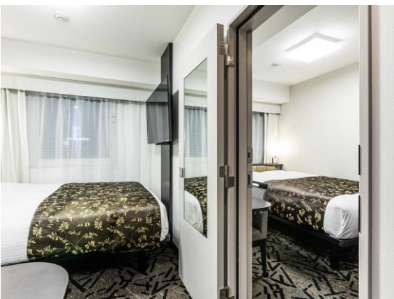
■コネクティングルーム