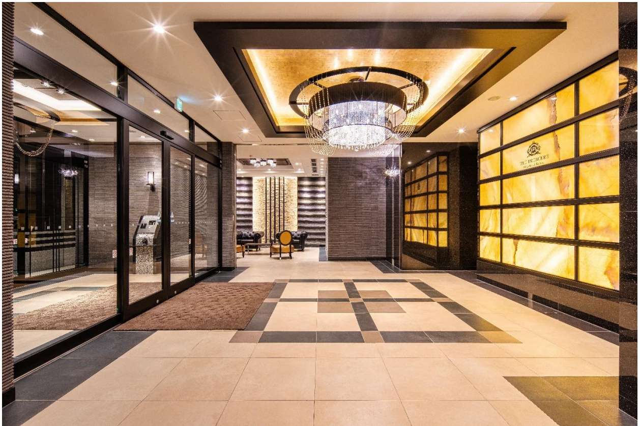
〈マンション エントランスホール〉