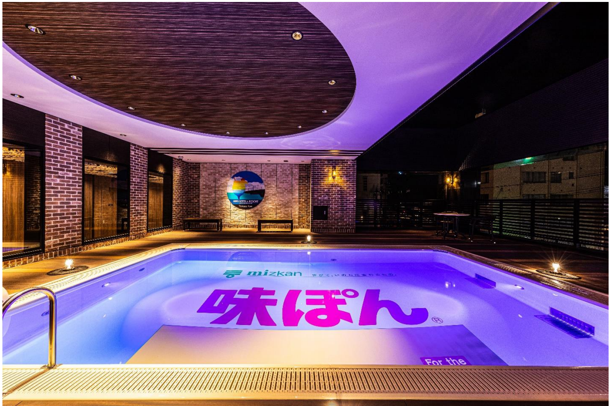
〈ホテル 味ぽん®プール〉