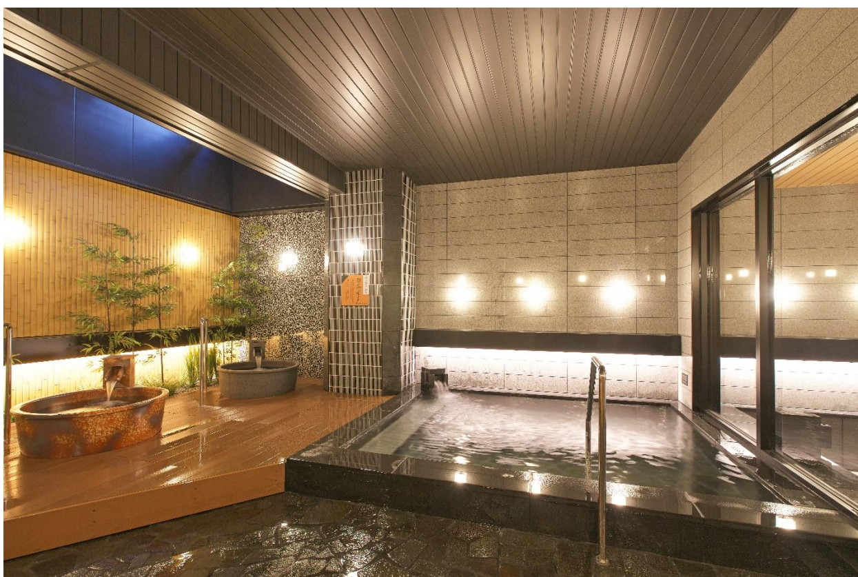
〈ホテル 大浴場 露天風呂〉