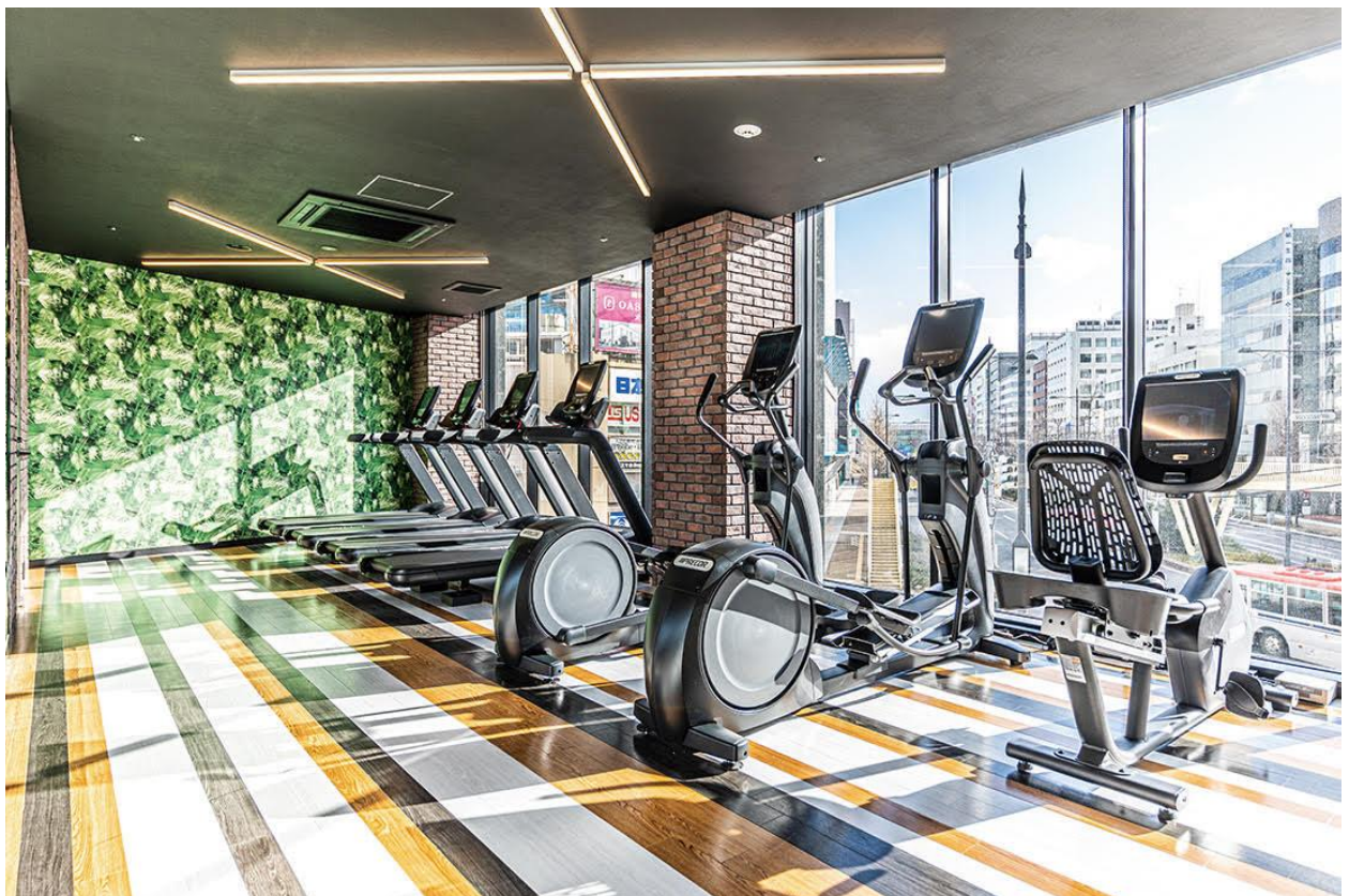
〈ホテル フィットネスルーム〉