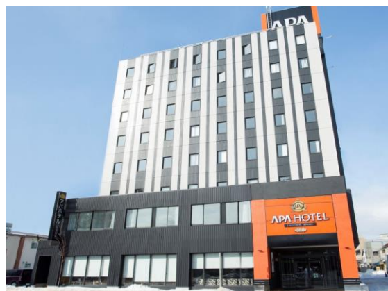
■アパホテル(函館駅前) 外観