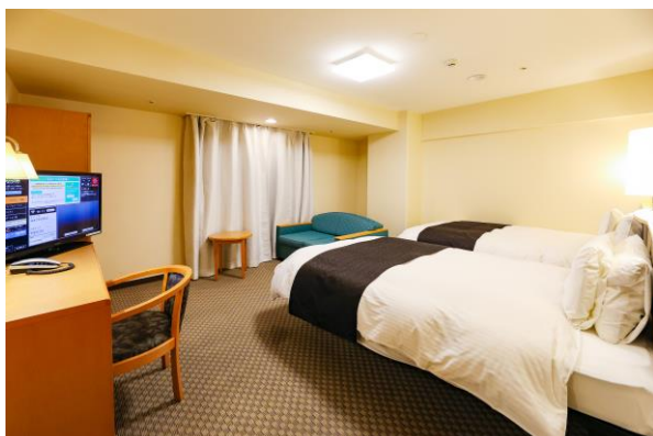
■アパホテル(帯広駅前)客室 (ツイン)