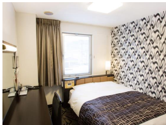
■アパホテル(函館駅前)客室 (シングル)