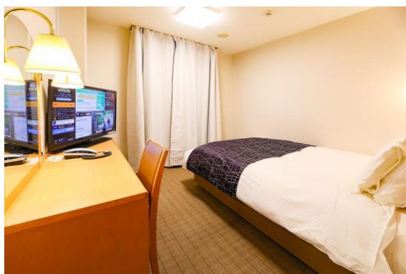
■アパホテル(帯広駅前)客室 (シングル)