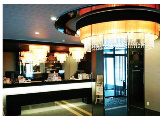
■アパホテル(函館駅前) ロビー