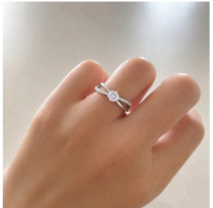
自社工房で仕上げたオーダーメイドリングの完成イメージ