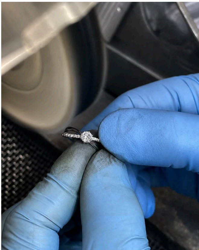
自社工房で職人が一つひとつ丁寧に仕上げる様子