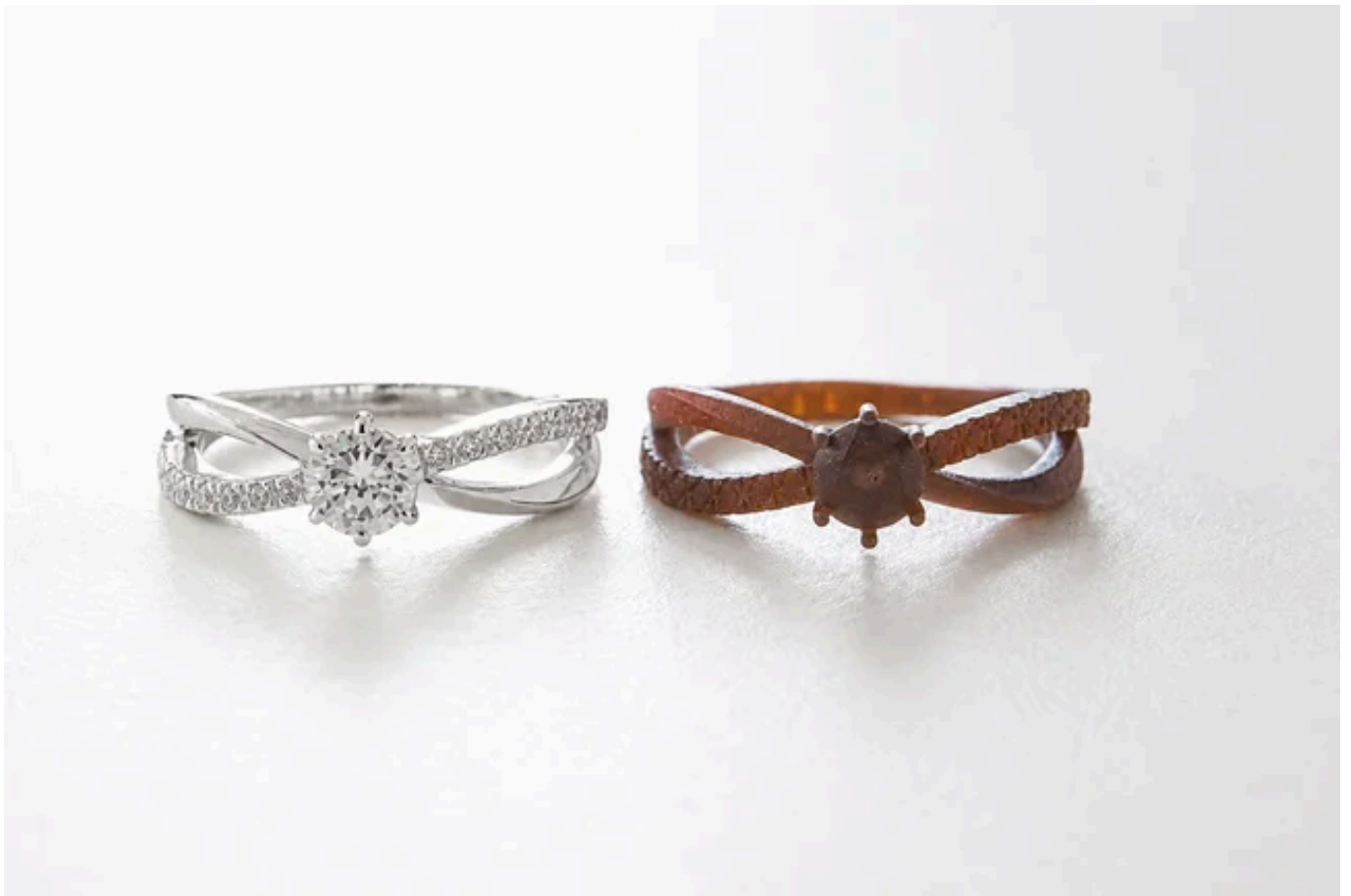
左：完成リング、右：本番制作前に確認できる実物大の樹脂サンプル