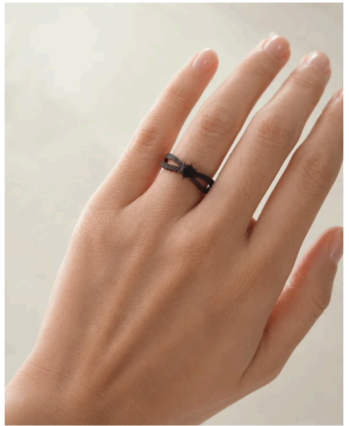
実物大の樹脂サンプルを左手薬指に着用したイメージ。

これにより、オーダーメイドにおける大きな不安のひとつである「イメージ違い」を軽減します。