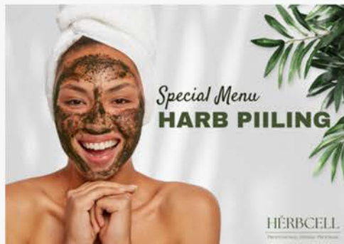
お客様提案資料16ページ PDF