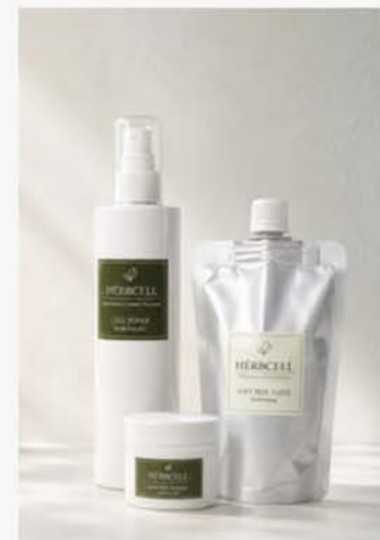
スタッフ施術ガイドブック PDF