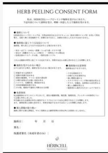
カルテ・同意書 20枚