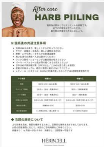
アフターケア (お渡し用) 20枚