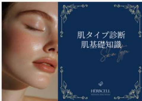
肌タイプガイドブック PDF