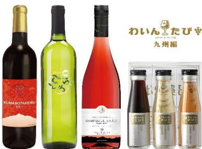
セット B イメージ ※フルボトルは参考イメージです