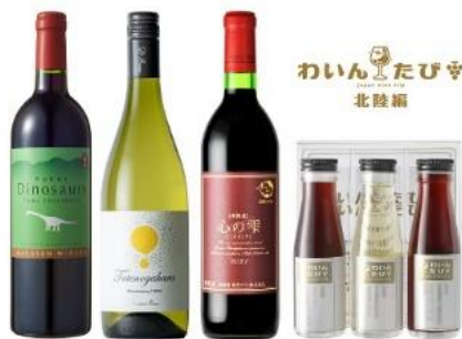
北陸編セットイメージ ※フルボトルは参考イメージです