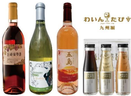
セット A イメージ ※フルボトルは参考イメージです