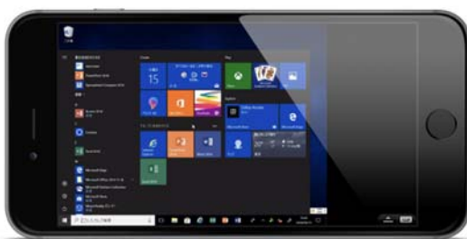
デスクトップ画面