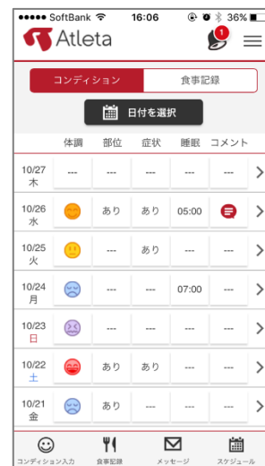
(スマートフォン画面イメージ)