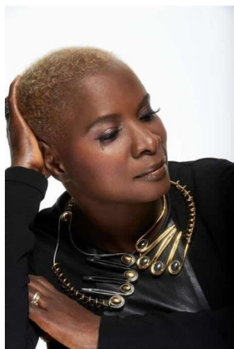
アンジェリーク・キジョー 音楽家/バンド