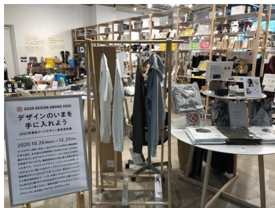
■2020年の同イベント開催中の丸の内店内の様子