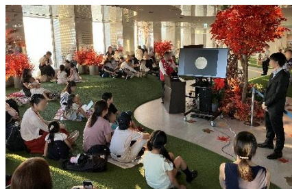
過去開催した満月観賞会の様子