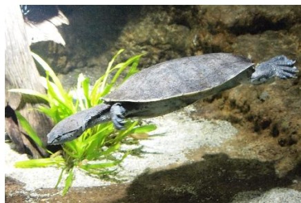
ヒラリーカエルガメ（ざんねんな生き方）