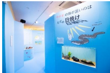
2020年開催「ざんねんないきもの展2」