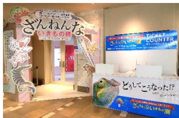
2017年開催「ざんねんないきもの展」

URL： https://sunshinecity.jp/file/aquarium/zannen/