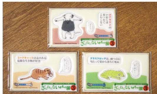
「ざんねんないきもの展3」オリジナルぷっくりシール（3種）

【対象施設】ユニカミルタプラネタリウム満天 in Sunshine City／サンシャイン60 展望台 てんぼうパーク／NAMJATOWN／古代オリエント博物館 ほか