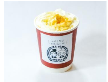
黒糖ウィンナーコーヒー/600円