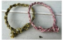
ワークショップでは「ベチバー」を使ってミサンガを作る体験も

その他、 沖縄物産展、噴水広場、水族館の3つのエリアを巡るとオリジナルステッカーがもらえるスタンプラリー を開催します。さらに、館内2階「ショップアクアポケット」では、めんそーれフェスタ期間よりオリジナルニット製エコバッグや、売上げの一部がサンゴの植え付けや保全活動に活用される「Sunna(さんな)ちゃんの恩返し黒糖」も販売しています。また、サンゴプロジェクト20周年の企画として、募金箱を設置しています。集まった募金は、恩納村へ寄付され、サンゴの健康チェック、ビーチクリーンなどの活動に使用いたします。