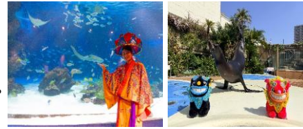
パフォーマンス 沖縄めんそーれフェスタver. (サンシャインラグーンフィーディングタイム、アシカパフォーマンスタイム)

日時：サンシャインラグーンフィーディングタイム 沖縄めんそーれフェスタver. 各日11:00～ アシカパフォーマンスタイム 沖縄めんそーれフェスタver. 各日11:00～、15:30～