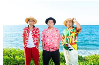
5月28日(木) きいやま商店