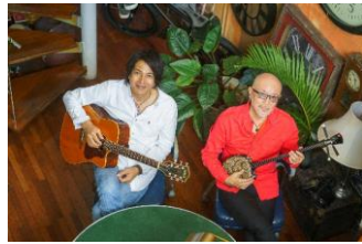
5月30日(土) THE SAKISHIMA meeting