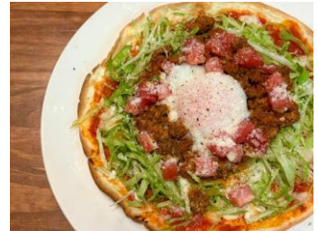
沖縄タコスピッツア/1,430円 ※数量限定

場 所：豊島区東池袋1-4-4 PAPHILLON BLDG. P-144 B1～2F