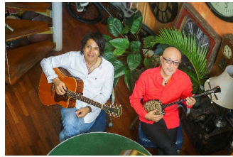
5月30日(土) THE SAKISHIMA meeting