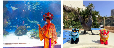
パフォーマンス 沖縄めんそーれフェスタver. (サンシャインラグーンフィーディングタイム、アシカパフォーマンスタイム)

日時：サンシャインラグーンフィーディングタイム 沖縄めんそーれフェスタver. 各日11:00～ アシカパフォーマンスタイム 沖縄めんそーれフェスタver. 各日11:00～、15:30～