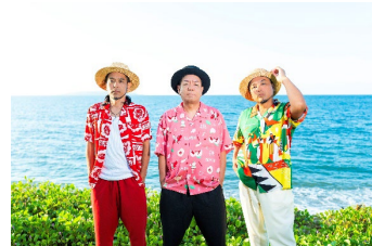
5月28日(木) きいやま商店