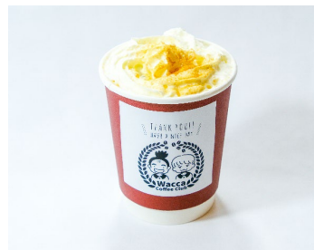
黒糖ウィンナーコーヒー/600円