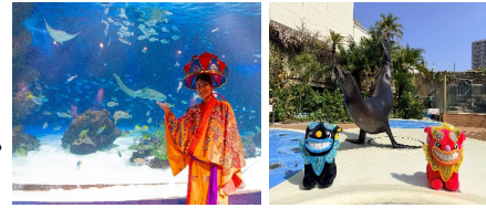
パフォーマンス 沖縄めんそーれフェスタver. (サンシャインラグーンフィーディングタイム、アシカパフォーマンスタイム)

日時：サンシャインラグーンフィーディングタイム 沖縄めんそーれフェスタver. 各日11:00～ アシカパフォーマンスタイム 沖縄めんそーれフェスタver. 各日11:00～、15:30～