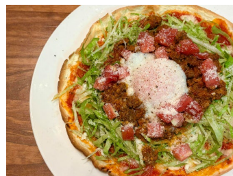
沖縄タコスピッツァ/1,430円 ※数量限定

場所：豊島区東池袋1-4-4 PAPHILLON BLDG. P-144 B1～2F