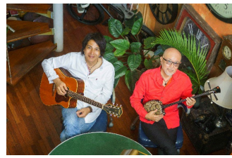
5月30日(土) THE SAKISHIMA meeting