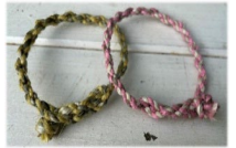
ワークショップでは「ベチバー」を使ってミサンガを作る体験も

その他、 沖縄物産展、噴水広場、水族館の3つのエリアを巡るとオリジナルステッカーがもらえるスタンプラリー を開催します。さらに、館内2階「ショップアクアポケット」では、めんそーれフェスタ期間よりオリジナルニット製エコバッグや、売り上げの一部がサンゴの植え付けや保全活動に活用される「 Sunna (さんな) ちゃんの恩返し黒糖 」も販売しています。また、 サンゴプロジェクト20周年の企画として、募金箱を設置 しています。集まった募金は、恩納村へ寄付され、サンゴの健康チェック、ビーチクリーンなどの活動に使用いたします。