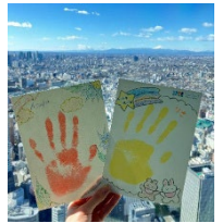
記念手形スタンプ例

各イベント参加方法などについてはウェブページをご確認ください https://sunshinecity.jp/observatory/event/entry-37501.html