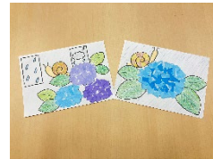
ちぎり絵 イメージ