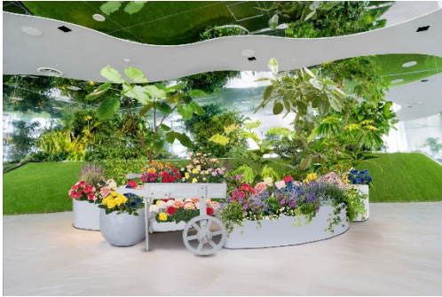
装飾のイメージ（前期：バラver.）

雨の日も暑い日でも天候を気にせず、赤ちゃん連れのご家族が安心して過ごせる“空の公園”へぜひお越しください。