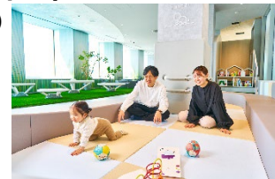
ハイハイスペース

館内には、18か月以下のお子様専用の「ハイハイスペース」を設置。さらに、館内に設置しているベビールーム（授乳室）には、ベビーシート（おむつ交換台）、授乳用個室に加え、調乳用温水器や電子レンジなど、お出かけの不安を解消する万全の設備をご用意。さらに、併設の「てんぼうパークCAFE」では、離乳食やキッズメニューもご用意しております。小さなお子様連れでも長い時間安心して過ごしていただけます。