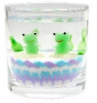
ジェルキャンドル イメージ