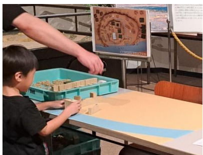
体験キットを用いた講座のイメージ