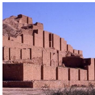
講演会「古代オリエンの建築史ーメソポタミアからペルシアへー」 イランの世界遺産チョガ・ザンビールの ジククラト(聖塔) 紀元前13世紀