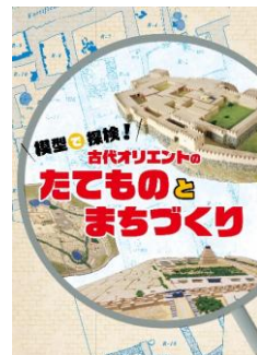
「古代オリエンのたてもとまちづくり - 模型で探検! -」展 図録 (B5判、オールカラー、32頁) 1,200円(予定)