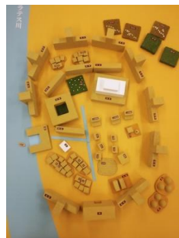
オリエン博物館オリジナルの体験キット