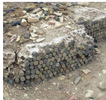
7月「メソポタミアにおける都市の誕生」 ウルク遺跡(イラク)に残る、4500年前の神 殿の一部

※事前申込制イベントの申込方法や各イベントの料金等詳細情報は ウェブページ をご覧ください。