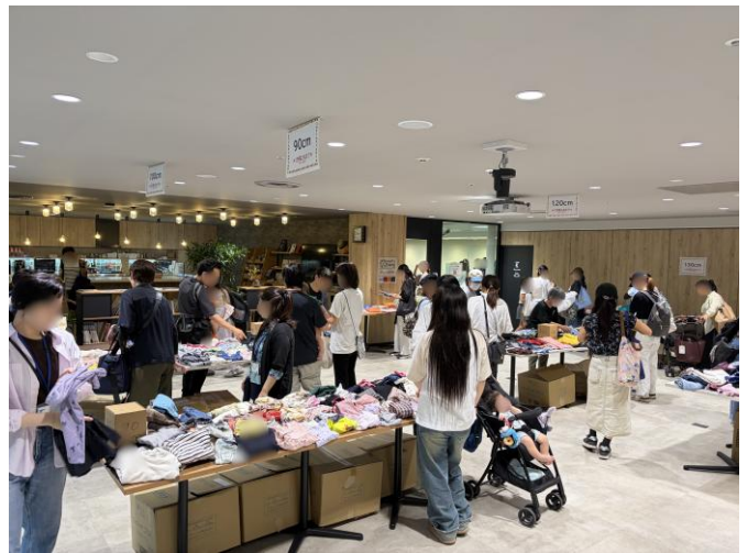
子ども服マーケットの様子