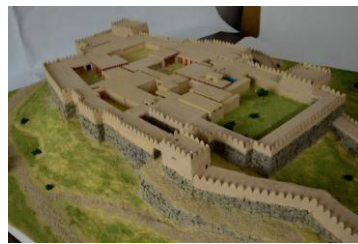
『巨人が作った』城壁

「人類最古の神殿」ギョベクリ・テペ、「世界最古の都市」ウルク、「バベルの塔」の都市バビロンなど、古代オリエントの建築や都市を30以上の縮尺模型と実物大模型で紹介。縮尺模型で遺跡や都市の全体像を立体的にたどりながら、実物大模型では古代の住居や墓の空間に入り込んだような臨場感を味わえます。夏休み期間中には、子供向け講座や体験コーナー、ミステリーツアーも実施し、親子で古代文明の“まちづくり”を楽しめます。