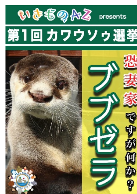
第一回カワウソ選挙 一位 ブブゼラ (ツメナシカワウソ)

今年も熱い戦いが予想される「いきものA Z presents 第二回カワウソ選挙」にどうぞご期待ください！