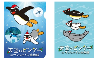
イベント限定 A6 クリアファイル 2 種