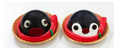
（左）ピングーケーキ （右）ピンガケーキ（各734円）