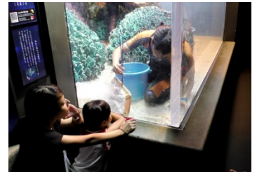
手早く生物を保護(応援してね！)