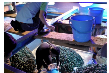
水槽の上にいるスタッフに手渡し