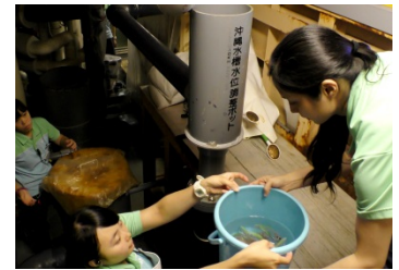
バックヤードは狭いのでバケツリレーで移動