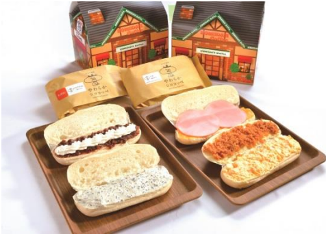
左：お花見おやつ (1,000 円) 右：お花見弁当 (1,260 円) コマダスタンド ※1 日各 10 セット限定

◇ 場所：コマダスタンド (アルパ 1F)、サラディッシュ (アルパ 1F)、グローカルカフェ (アルパ 1F)、サブウェイ (アルパ 1F)、成城石井 (アルパ 1F)、カレーハウス CoCo 壱番屋 (アルパ B1)、スープストックトーキョー (アルパ B1)、天井てんや (アルパ B1)、仙台牛たん 郷土料理 杜の都 太助 (アルパ 3F)