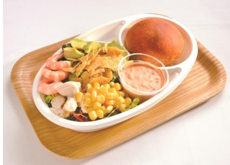
ミニコブサラダとパンのセット (700 円) サラディッシュ