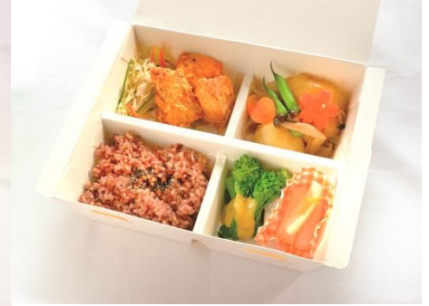
季節のほっこり弁当 (1,000 円) グローカルカフェ ※10 個以上の場合は前日までに要予約