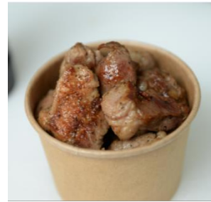
塩コロジンギスカン(800円)