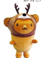
キュンちゃん(北海道観光 PR キャラクター)