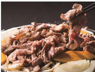
ジンギスカン(各種 900円)

屋外特設会場では、海鮮や肉を炭火焼きで堪能できるほか、サッポロビールとジンギスカンを味わえる「北海道まるごとビアガーデン」を開催します。※荒天中止