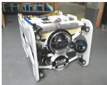
水中ドローン (DIVE unit 300)

サンシャイン水族館（東京・池袋、館長：丸山克志）は、水深200mほどの深海の入り口に棲む生き物を観て触れて味わえる冬限定の人気イベント「ゾクゾク深海生物2020～未知なる世界へ～」を2020年1月10日（金）～3月8日（日）の期間に開催します。今回は、「冒険」「探検」をテーマに、様々な深海のコンテンツが登場します。