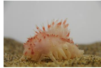
ヒメカンテンナマロ