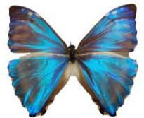
昆虫万華鏡のイメージ（モルフォチョウの仲間）