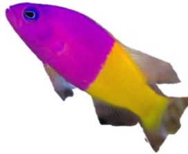
バイカラードティーバック