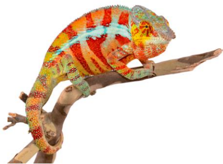
パンサーカメレオン

真っ白な空間には生き物をもつ体色だけが映えており、白い空間に鮮やかな彩りを与えます。生き物本来の色味を活かすため、会場内の装飾も白色で統一。白い世界に迷い込んだ不思議な感覚を堪能することができます。白の世界のラストのコーナーに展示されている「パンサーカメレオン」は、次のエリア“カラフルな世界”の空間へ誘います。