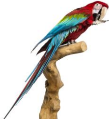
ベニコンゴウインコ

フォトジェニックな空間に相応しく、装飾や生き物自体がもつ色で、鮮やかでカラフルな世界を創りだします。カラフルな生き物の魅力を最大限に活かせるよう、体色や模様から連想した装飾は、見ごたえ十分でSNS映え間違いなしです。様々なアングルから鑑賞したり、写真を撮って、生き物のさらなる魅力を発見できるエリアです。