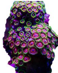
マメスナギンチャク