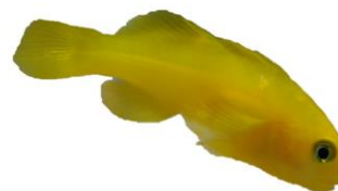
キイロサンゴハゼ