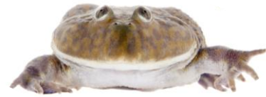
マルメタピオカガエル