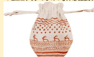
「彩文どきんちゃく」作品例