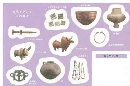
配布予定シールキット

また、子どもが自分たちのオリジナル展示会を作ることができる「展示会をつくろう」シールキットを数量限定で無料配布いたします。種類はテーマごとに「最古のオリエント」「古代メソポタミア」「古代エジプト」「古代イランとその周辺」「東西交流」の全5種となり、週替わりで配布します。