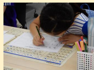
「ヒエログリフのひみつ」体験風景

本物の古代の彩文土器のかけらを観察して、彩文土器のデザインを施したオリジナル「彩文どきんちゃく」を制作できます。