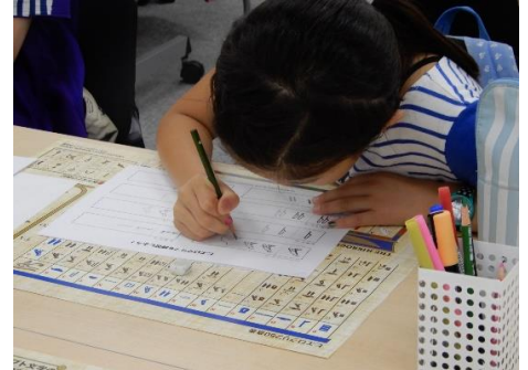
「ヒエログリフのひみつ」体験風景