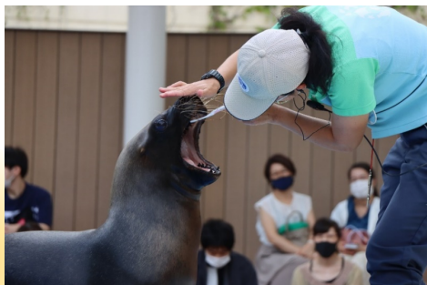
アシカも歯みがきでオーラルケア