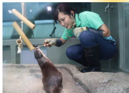
カワウソのトレーニング