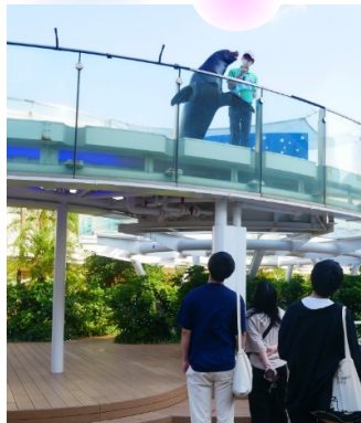
アシカとトレーナーが皆さんにご挨拶