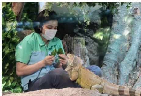
グリーンイグアナの給餌