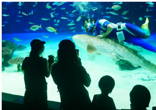
トラフザメと仲良く遊泳