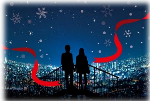
体験の様子(イメージ)

地上227mからの眺望を体全体で感じられることはもちろん、この期間だけの特別貸し切りとなる展望台の屋上にて、クリスマスの一生の思い出や記念になるようなひと時を過ごしたり、なんの遮りもない夜景を一望できる場所で、思う存分 撮影を楽しんでいただくなど、楽しみ方はお客様次第。この時期ならではの貴重な機会にぜひ、サンシャイン60展望台にお越しください！