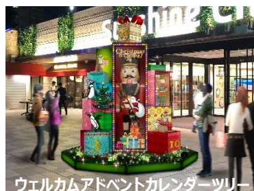
ウェルカムアドベントカレンダーツリー