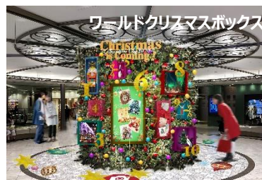
ワールドクリスマスボックス