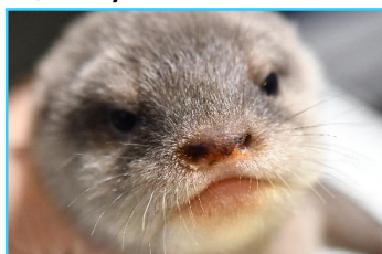
鼻の色が中間的な黒さ。一番大きい