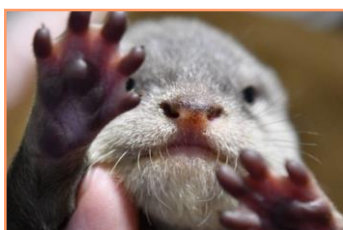
鼻の色が一番薄い(特に下半分)。二番目に大きい