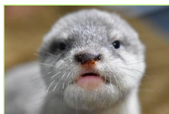
鼻の色が黒い。一番小さい