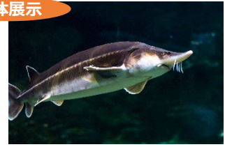
チョウザメの仲間