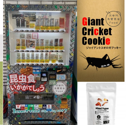
昆虫食自動販売機 (各商品750円～)