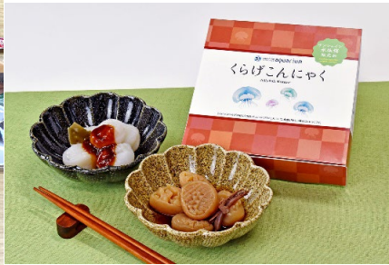
サンシャイン水族館オリジナル商品「くらげこんにゃく」(972円)