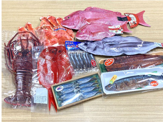
鮮魚コーナーのような売り場では鮮魚をモチーフにした商品を販売

スーパーの鮮魚コーナーをイメージしたユニークな販売コーナーが登場！食にまつわる商品を各種取り揃えるほか、 大コオロギが1匹乗ったインパクト抜群の「ジャイアントコオロギクッキー」 などが買える 昆虫食自動販売機 を設置。特別展をご覧いただいた後はぜひお立ち寄りください！