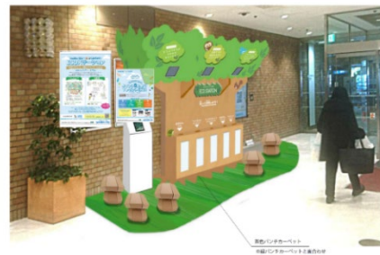
ECOステーション イメージ

※ECOステーションは主に廃材となった木材や再利用可能な段ボールを使用し制作しています。