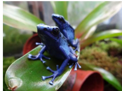
アイソメヤドクガエル コバルト型

“いつでも どこかで 何かが起きている”サンシャイン水族館の「いきものディスカバリー」。本期間中は、爬虫類のお散歩が見られるかも！