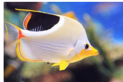
左：カシミチョウチョウウオ 右：セグロチョウチョウウオ