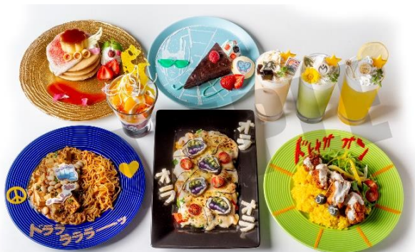
※画像はイメージです。 「ジョジョの奇妙な冒険」アニメ10周年記念展 実行委員会 ※東京会場のみメニューとなります。 © 荒木飛呂彦&LUCKY LAND COMMUNICATIONS/集英社・ジョジョの奇妙な冒険 THE ANIMATION PROJECT

※「JOJO10years Anniversary café」営業時間 OPEN 11:00 / CLOSE 21:00 (フードラストオーダー20:00、ドリンクラストオーダー20:30)