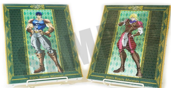
※画像はイメージです。 「ジョジョの奇妙な冒険」アニメ10周年記念展 実行委員会 © 荒木飛呂彦&LUCKY LAND COMMUNICATIONS/集英社・ジョジョの奇妙な冒険 THE ANIMATION PROJECT

さらに、奥にはコラボカフェ『JOJO10years Anniversary café』が待ち構えている。東京会場でしか味わえない、キャラクターをモチーフにした全9品のメニューが揃っているので、展示をすべて見終わったらひと休みしつつ、最後までじっくりと堪能してほしい。