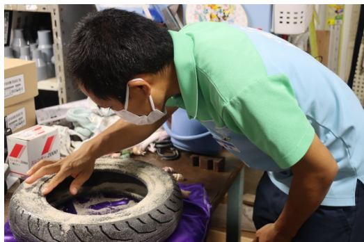
オリジナル模型を制作する様子

飼育スタッフが約1か月かけて一から制作したオリジナル模型が登場。人間の生活が影響して発生する海の生き物の「死」について、模型を通して課題の発見をしてみませんか？