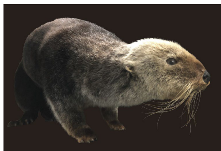
ロシアラッコの剥製

館内には、当館で展示する生き物たちの死、環境問題によって発生する生き物たちの死、また絶滅危惧種に関する解説パネルを設置して展開します。そして、このイベント期間限定で当館所有の“ロシアラッコの剥製”を展示するほか、絶滅危惧種に指定されている“チュウゴクオオサンショウウオ”を展示します。