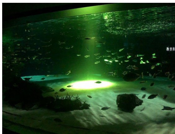
本イベントをイメージした照明の大水槽「サンシャインラグーン」

本イベントをイメージした照明で普段とイメージが異なる大水槽「サンシャインラグーン」を背景に写真が撮れるフォトスポットが登場します。