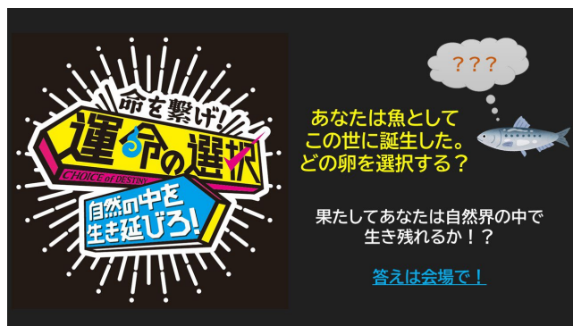
命を繋げ！運命の選択～自然の中を生き延びろ！～のクイズ例

飼育スタッフが考案し、一から制作した、生き物が過酷な自然界を生き抜く術をクイズ形式で学べるコンテンツを体験できます。実際に生き物たちに起こりうることを題材に、与えられる選択枝の中であなたは生き残れるか！