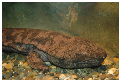
チュウゴクオオサンショウウオ

さらに、飼育スタッフが一から制作した、生き物たちが過酷な自然界を生き抜く術をクイズ形式で学べるコンテンツ「命を繋げ！運命の選択～自然の中を生き延びろ！～」や海の環境問題について考える「オリジナル模型」が登場。また、サンドアート集団SILT（シルト）による生き物の命のバトンが繋がっていく様子を描いたサンドアート作品の動画を放映します。