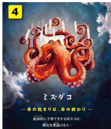
展示解説パネルイメージ

今回のイベントテーマに沿った生き物の解説パネルを展示。イラストを用いて、生き物の死や絶滅に関する内容を生き物ごとにわかりやすく解説します。