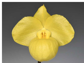
パフィオペディルム・アルメニアカム

今回はパフィオペディルムの育種を楽しむ会員が登壇し、栽培のコツや育種の魅力などを紹介するとともに、参加者からのご質問にもお答えいたします！