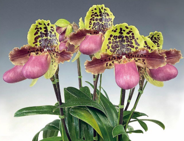
パフィオペディルム・ヘンリアナム (原種の1種)

サンシャインシティ(東京・池袋)では、2023年1月5日(木)から9日(月・祝)までの期間、魅惑的な世界中の蘭を大規模に展示する新春恒例のイベント「第62回全日本蘭協会洋らん展 サンシャインシティ世界のらん展2023 ～The Orchid is All (蘭こそすべて)～」を開催します。世界トップレベルの整った大輪花から、予想外の形やサイズなど自然の妙を感じさせる花まで 展示株数は約800株 にのぼり、多種多様な蘭の展示・販売や専門家による講演など、蘭に関する情報を様々な角度から得られるイベントです。