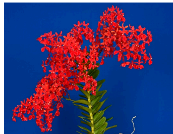
レナンセラ・フィリピンシス

全日本蘭協会と関東近県の蘭愛好団体による出品花を団体ごとに展示します。例年、各団体の特色が現れた華やかな展示が展開されます。