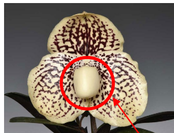
原種パフィオペディルム 唇弁

袋状の唇弁 しんべん が特徴的なパフィオペディルムは、カトレヤの華やかさに対して落ち着いた美しさが魅力で、長年洋らん愛好家を魅了してきました。現在自然交雑種を含む109種が報告されていますが、近年になっても新種の報告が止むことはありません。種ごとに開花時期が異なるため、同時に全ての種をお見せすることはできませんが、会期中に開花している10種以上の生花にパネルを加えて、バラエティ豊かな魅力をご紹介します。