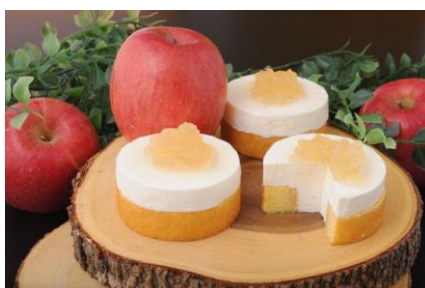
小樽ゆきねりりん