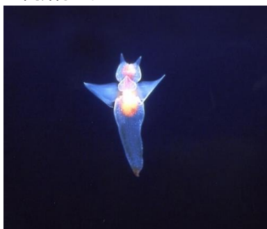
ハダカカメガイ (通称：クリオネ)