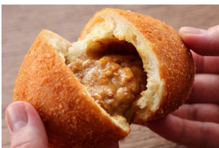
十勝モッツアレラチーズカレーパン