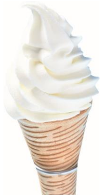
ブラウンスイスプレミアム ソフトクリーム

出店：ひがし北海道ミルククラウン・溝口農場・養老牛山本牧場・Dairymaid みらく san・宇野牧場