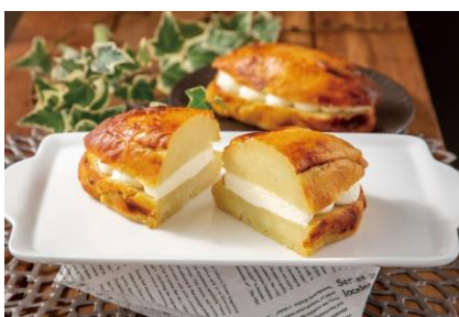
白い半熟スイーツポテト