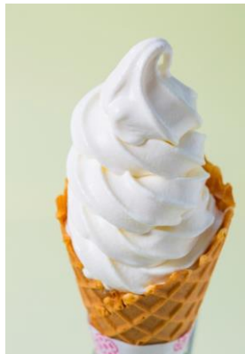
究極の無添加 はちみつソフトクリーム