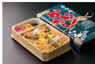
かなやのかにめし