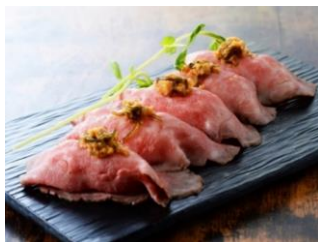
十勝ハーブ牛の サーロイン肉寿司