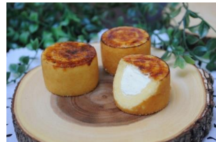
ブリュレカスタードインバウム