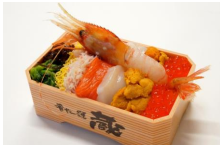
ボタン海老五色盛弁当

からあげグランプリ金賞を通算5回受賞した「ザンギ（唐揚げ）」や海鮮5種の上にボタン海老が豪快にのった「ボタン海老五色盛弁当」、毛蟹・いくら・ウニがのった究極の「豪快三色弁当」をはじめ様々な海鮮を使用した丼や弁当が登場します。また、カレーパングランプリでのチーズカレーパン部門3年連続金賞を受賞したチーズカレーパンや2017東京ラーメンショー最優秀賞を受賞したラーメンが登場するなど、北海道の味覚を代表する食材や食事がイートインで揃います。