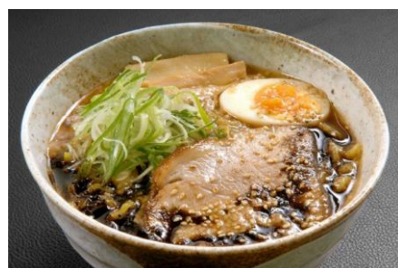
焦がし味噌らーめん