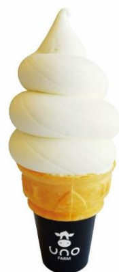
最高峰有機牛乳の もこもこソフト